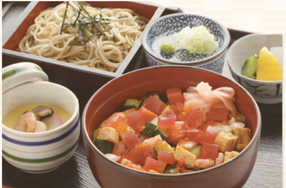
ばらちらし 寿司単品 (みそ汁・お新香付き) 1,600 円