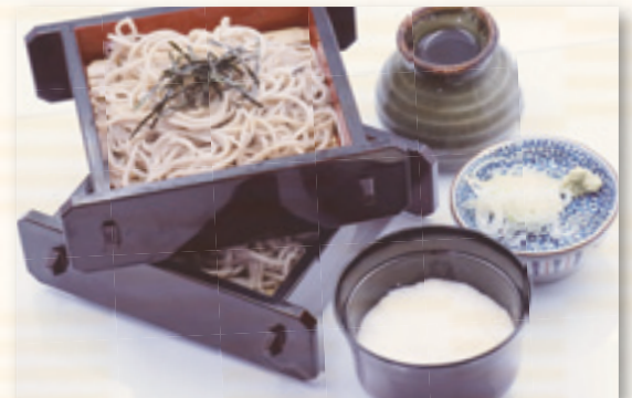
とろろそば (うどん) 1,280 円