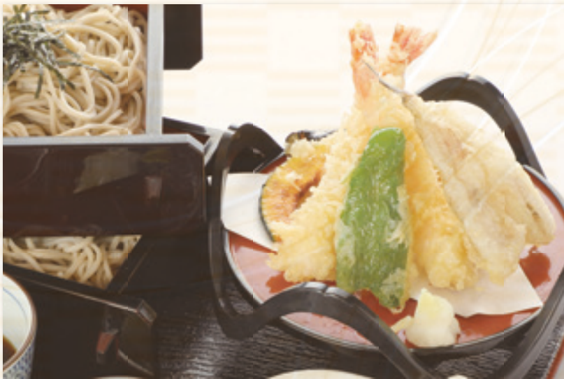
天せいろそば (うどん) 1,750 円