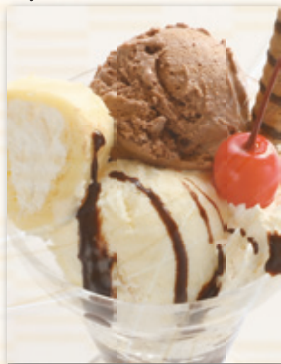
チョコレートパフェ 700円