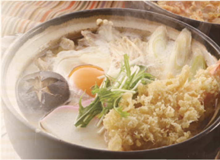
海老天鍋焼うどん 1,280 円