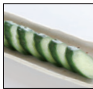
胡瓜の一本漬け 400 円