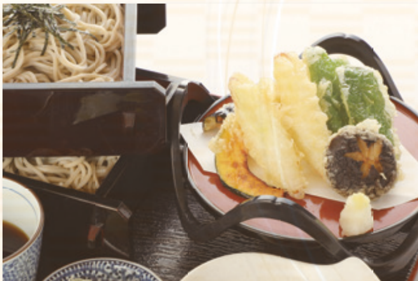
野菜天せいろそば (うどん) 1,500 円