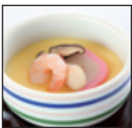
茶碗蒸し 400 円