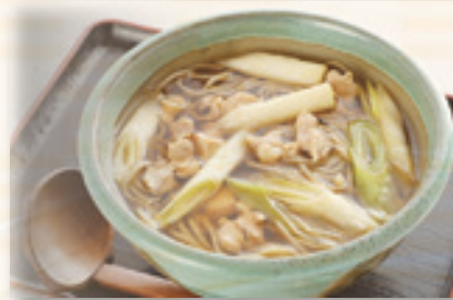
とり南蛮そば (うどん) 1,080 円