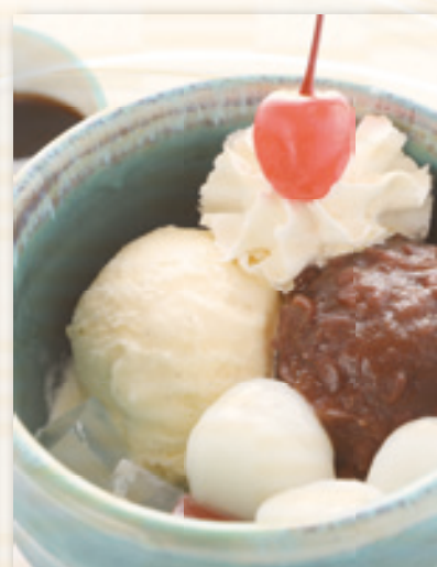
白玉クリームあんみつ 700円