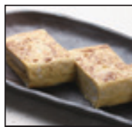
そば屋の厚焼き玉子(小) 350 円