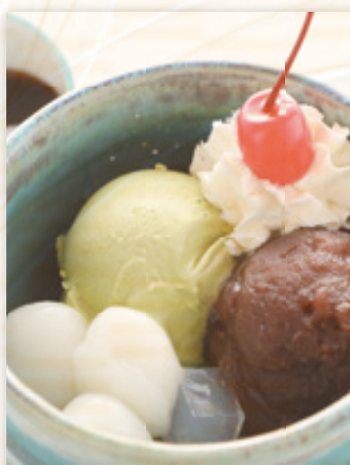
白玉抹茶あんみつ 700円