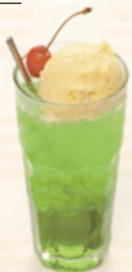
クリームソーダ 600円