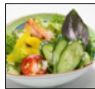
ミニサラダ 300 円