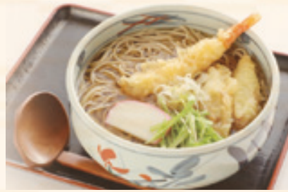
海老天ぷらそば (うどん) 1,080 円