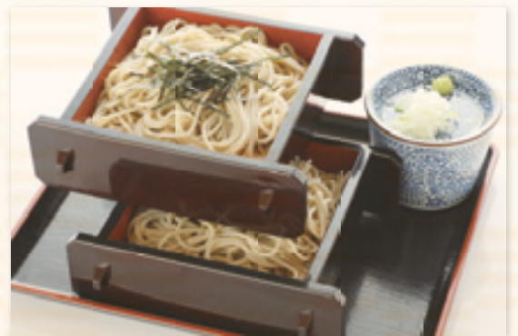
せいろそば (うどん) 950 円

当店のそばは、そば粉を精選した玄そばを脱皮し 甘皮を引き込んだ風味豊かな「二八の挽きぐるみそば」です。 つゆは、宗田鯉・鯖節でだし汁をとり、辛口で仕上げております。