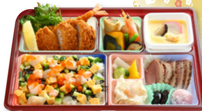
ちらし寿司慶事弁当 2,900円(税込)