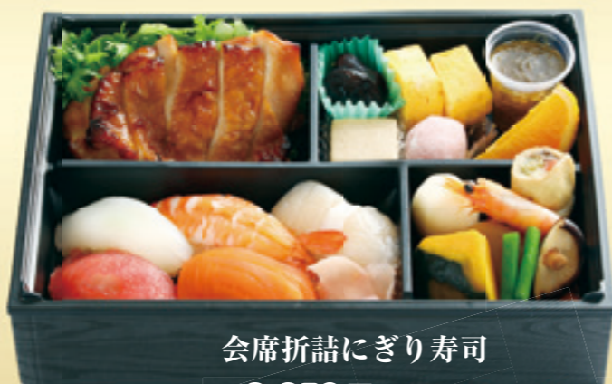
会席折詰にぎり寿司 2,650円(税込)