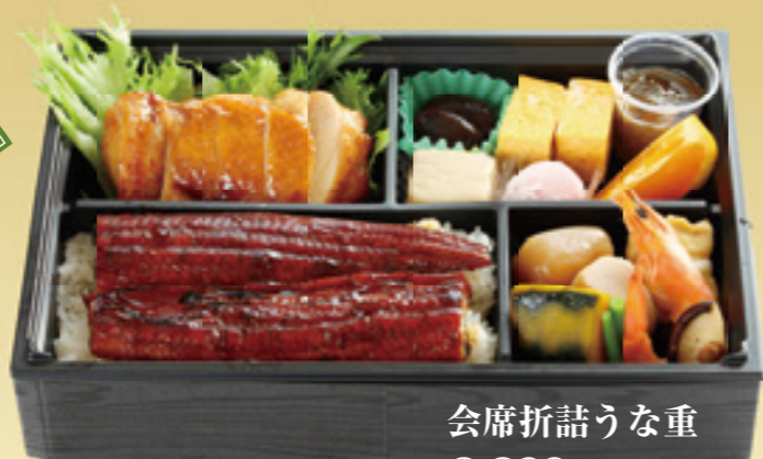
会席折詰うな重 3,300円(税込)