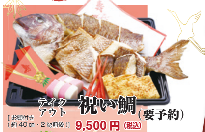
祝い鯛(要予約) テイクアウト 【お頭付き(約40cm・2kg前後)】 9,500円(税込)