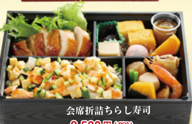
会席折詰ちらし寿司 2,500円(税込)