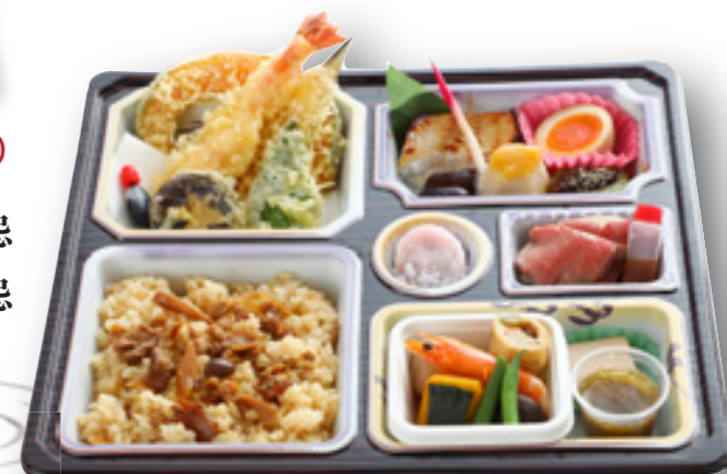
味ごはん法事弁当 2,400円(税込)