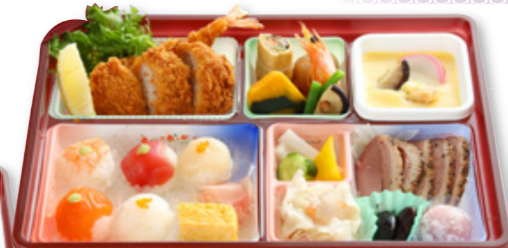
手まり寿司慶事弁当 2,850円(税込)