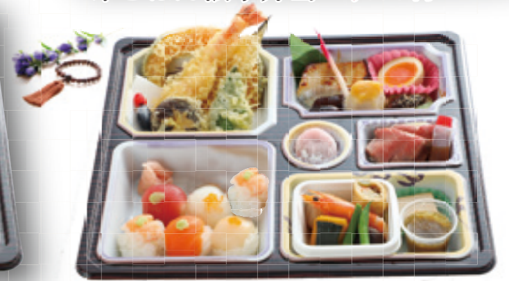
手まり寿司法事弁当 2,600円(税込)