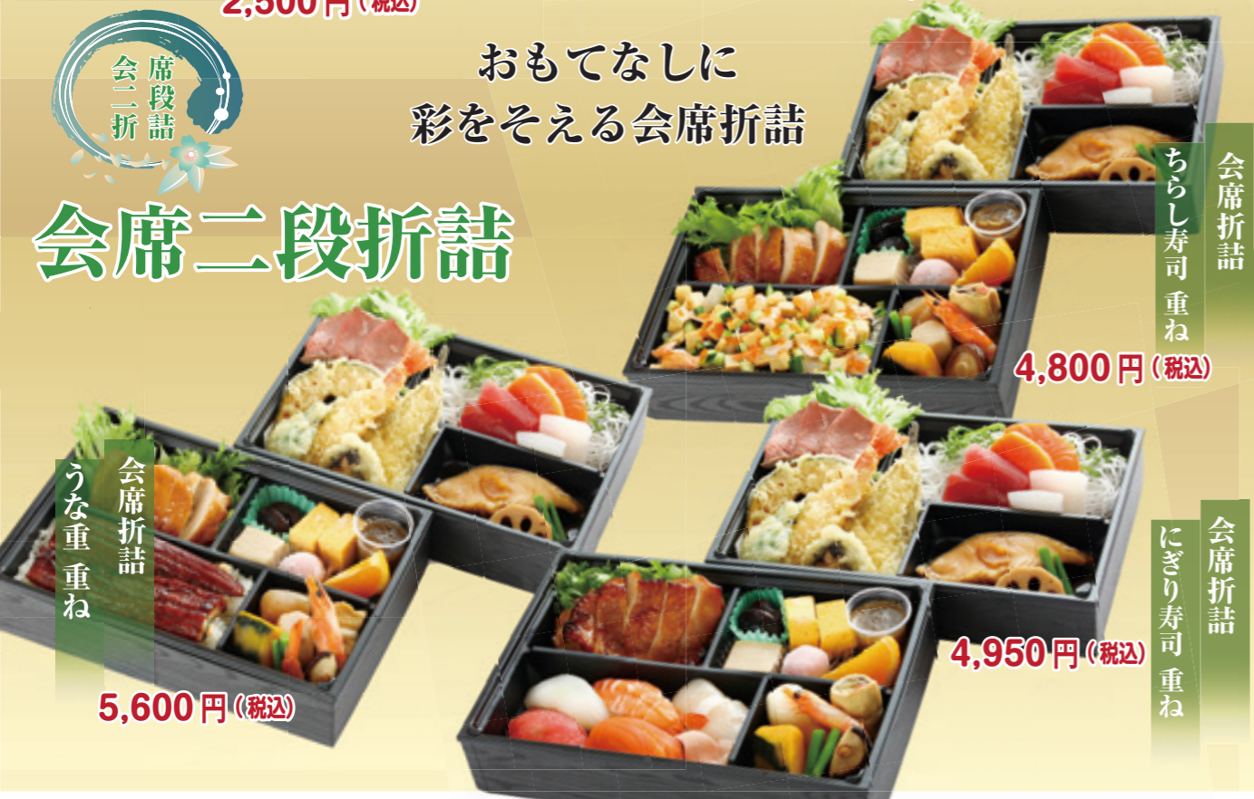
会席折詰 ちらし寿司重ね 4,800円(税込)