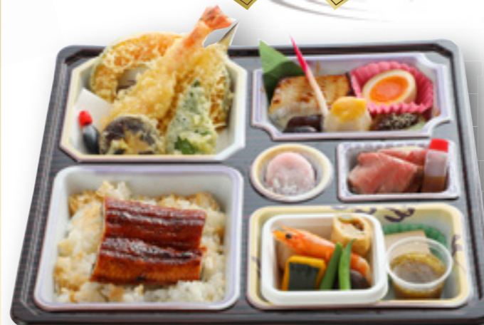
うなぎ法事弁当 2,900円(税込)