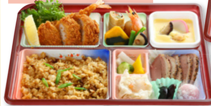
鯛めし慶事弁当 2,800円(税込)