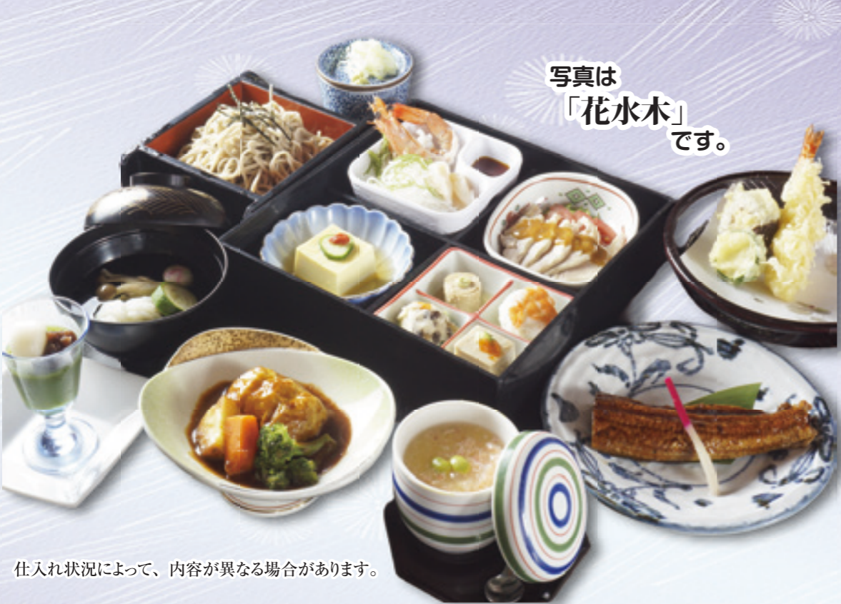
仕入れ状況によって、内容が異なる場合があります。