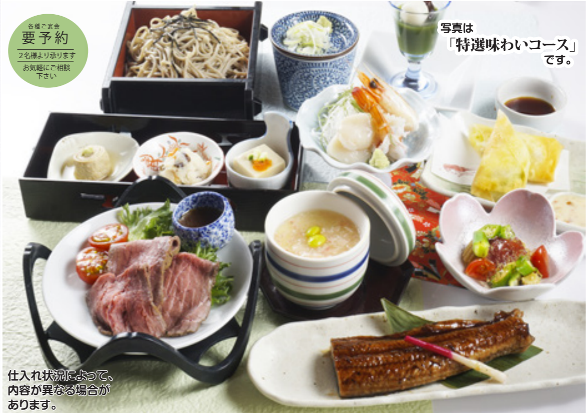
写真は「特選味わいコース」です。